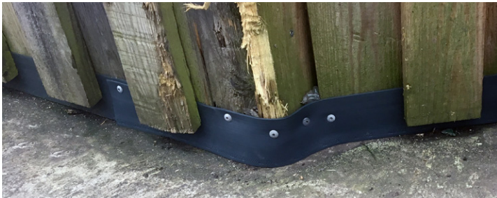
Exemples d'application sur clôtures

La bande découpable rongeurs Raxit NE DOIT PAS être utilisée pour les portes et les portails, car la friction causée par l'ouverture et la fermeture des portes et des portails pourrait faire glisser les fils d'acier noyés. Le rouleau peut être découpé à l'aide d'une pince coupante, d'un cutter ou d'une scie pour obtenir la longueur souhaitée.